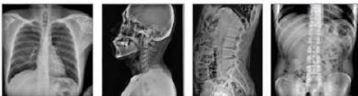
Imagen de alta calidad